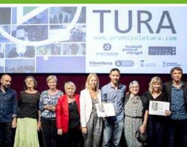
Septiembre VI edición del Premio Solé Tura de cine sobre enfermedades del cerebro.