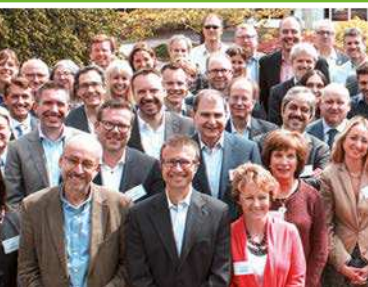
Enero Puesta en marcha del consorcio European Prevention of Alzheimer's Dementia (EPAD) .