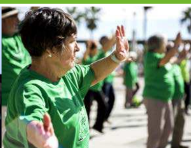
Septiembre Día Mundial del Alzheimer con la actividad "Pon el corazón para cuidar el cerebro".