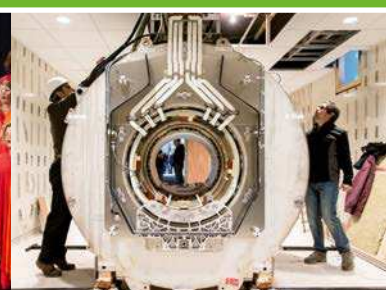
Diciembre Nuevo equipo de imagen por resonancia magnética.