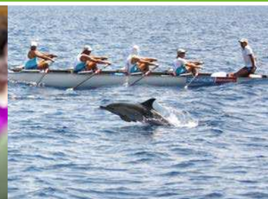
Julio Travesía solidaria a remo "90 millas contra el Alzheimer", impulsada por el Club Deportivo Olímpico Barcelona.