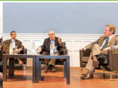
Junio Primer acto del Claß en Madrid, con el periodista Iñaki Gabilondo .