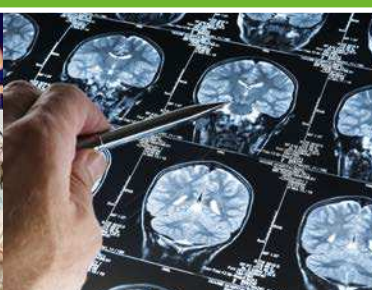
Octubre Monitorización y gestión de los datos obtenidos en la primera fase de visitas del Estudio Alfa .