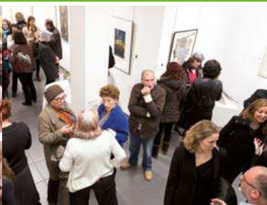
Marzo Nueva exposición de "Arte a Conciencia" en la Galería de Arte Dolors Junyent.