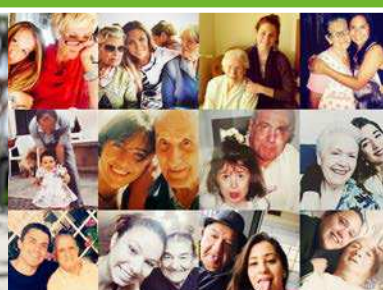
Septiembre #AbuelosForever , homenaje a los abuelos y las abuelas en las redes sociales.