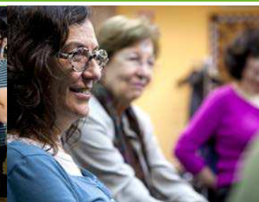
Junio Finalización del estudio sobre la eficacia de los grupos terapéuticos con 179 cuidadores participantes.