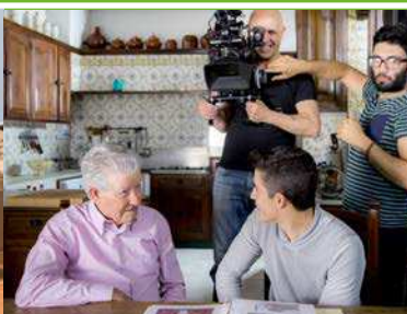
Junio Presentación de la campaña protagonizada por el piloto de MotoGP Marc Márquez y su abuelo.