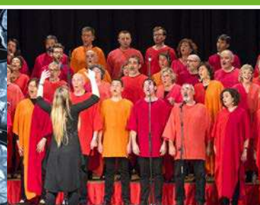
Noviembre Concierto de gospel solidario del coro "Gospel Gràcia".