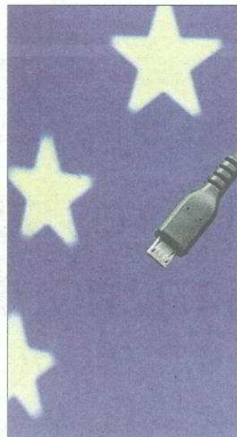
El conector único micro USB