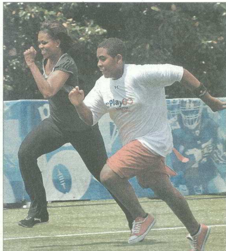
Michelle Obama durante una carrera para fomentar el ejercicio en 2010.

Pero ya lo dice el chef español José Andrés, colaborador de Michelle Obama en temas gastronómicos y habitual en los fogones de la Casa Blanca: "La palabra comida sigue ausente de los temas de importancia en la página web de la Casa Blanca". Aunque Andrés corrige, bromista, enseña: "Excepto cuando se habla de una cena de Estado".