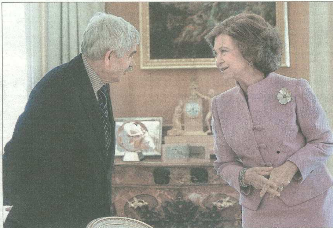
La Reina charla con el expresidente de la Generalitat Pasqual Maragall a su llegada ayer a La Zarzuela.

Las fundaciones que la Reina y Maragall (afectado por esta enfermedad) presiden son las principales promotoras del consorcio que llevará a cabo, entre otras iniciativas, la cumbre internacional sobre el alzhéimer, que afecta a unos 430.000 españoles, los días 22 y 23 de septiembre.