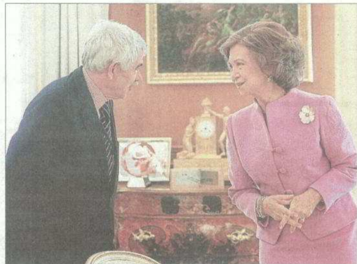
La reina Sofía y Pasqual Maragall, ayer, en la Zarzuela