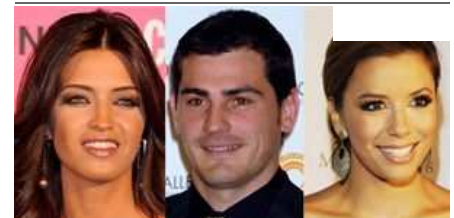
IKER CASILLAS Y SARA CARBONERO, DE CENA CON EVA LONGORIA Y ALEJANDRO SANZ