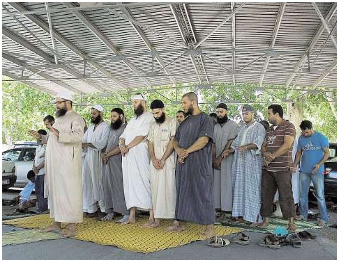
Los musulmanes de Lleida han trasladado sus rezos a una marquesita alejada del centro.