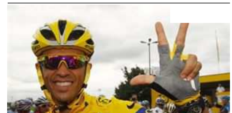
CONTADOR NO CORRERÁ LA VUELTA A ESPAÑA