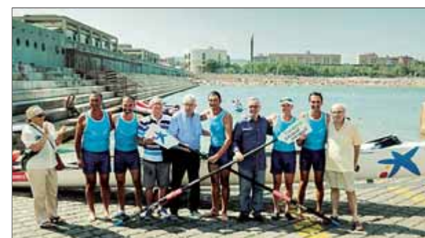
Pasqual Maragall rebent els remers al port

glucòmetre, també permet controlar l'evolució de la malaltia, analitzant periòdicament el grau de celiaquia del pacient, així com avaluar els familiars directes d'un malalt diagnosticat. La investigadora María Isabel Pividori assenyalava que "ja estem en la fase de validació clínica i preparant amb Acció la millor manera de comercialitzar aquesta tecnologia". Una de cada cent persones pateix intolerància al gluten, una proteïna present en cereals tan habituals en la nostra dieta com el blat, l'ordi, la civada o el sègol. Segons aquesta proporció, a Catalunya hi hauria uns 70.000 afectats. ■ REDACCIÓ