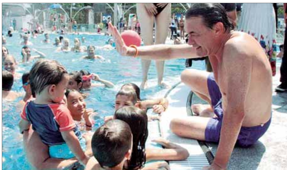
El president Artur Mas 'es va mullar' ahir per l'esclerosi múltiple