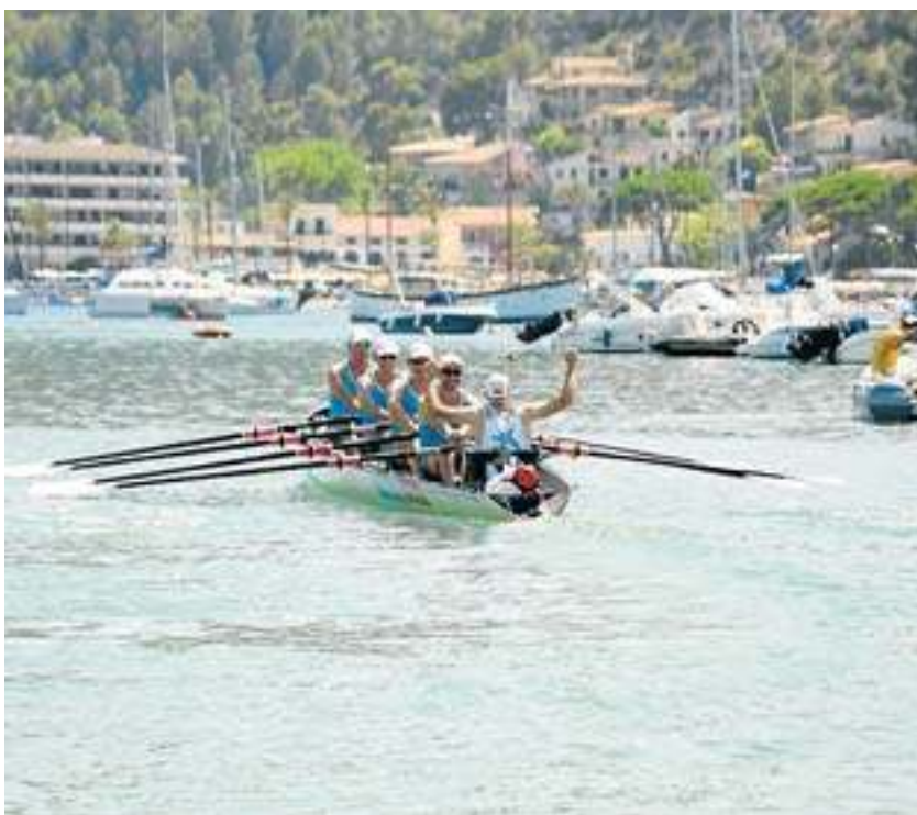
Els remers que partiren ahir del port de Sóller volen contribuir en la recaptació de fons per a la investigació contra l'alzhèimer.

L'objectiu d'aquest projecte de sensibilització ciutadana és recaptar