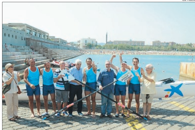
E. Banda, Pasquall Maragall y Jordi Cami recibieron a los participantes

Los cinco participantes en la travesía épica «90 millas contra el Alzheimer», llegaron ayer al Puerto de Barcelona completando así una iniciativa solidaria impulsada por la Caixa y en beneficio de la Fundació Pasquall Maragall. El dinero que se recaude de las 100.000 paladas, que se pueden adquirir por un 1 euro, se destinarán íntegramente a la Fundación Pasquall Maragall para la