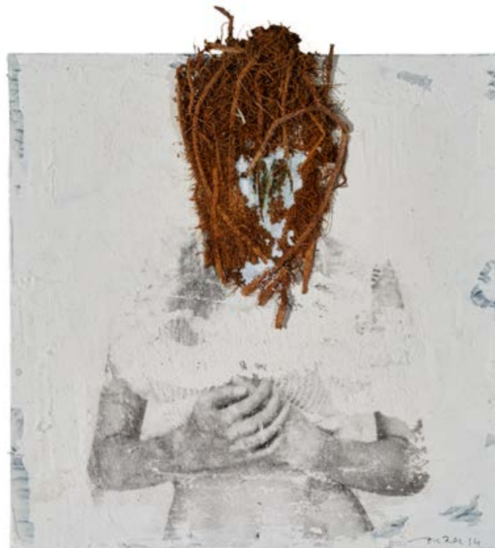
Gretel 2 , 2015 Tècnica mixta sobre paper 20 x 20 cm