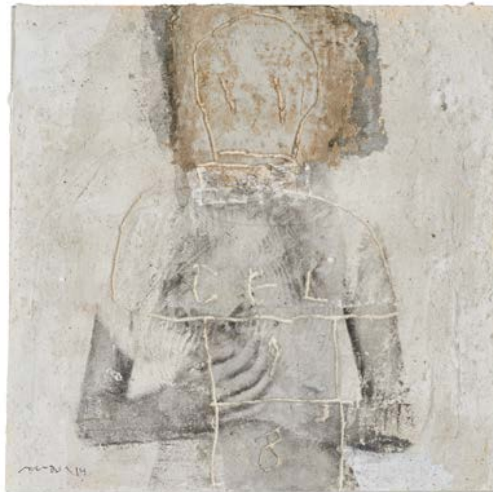
Gretel 3 , 2015 Tècnica mixta sobre paper 20 x 20 cm