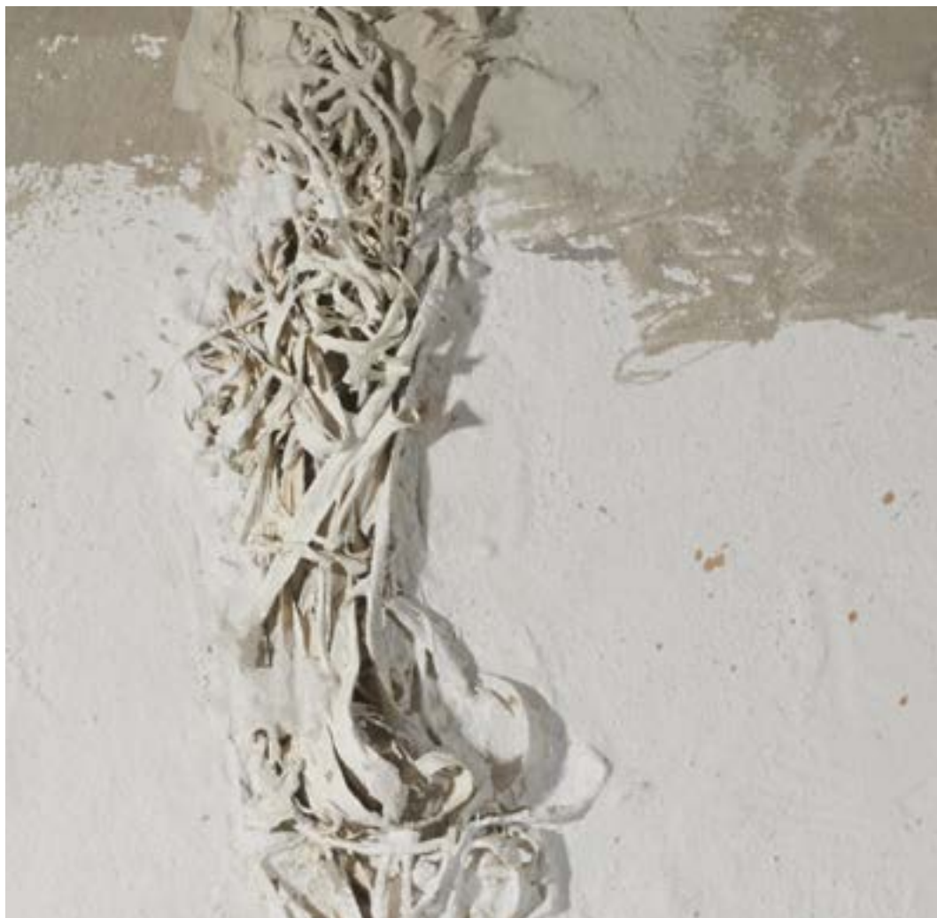
Detall de l'obra Cartografia de la ment