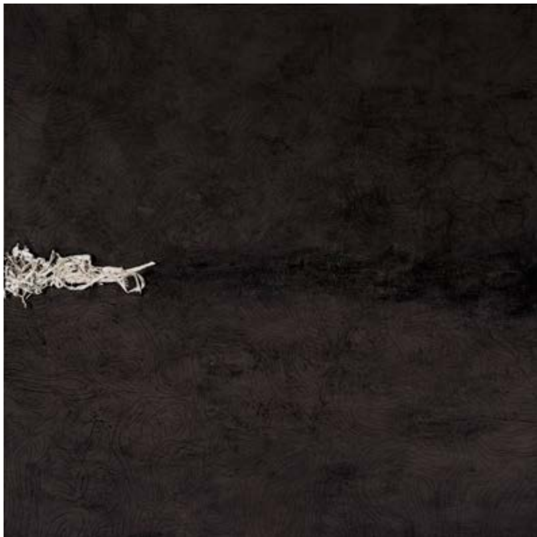
Transgressió , 2015 Tècnica mixta sobre tela 175 x 175 cm