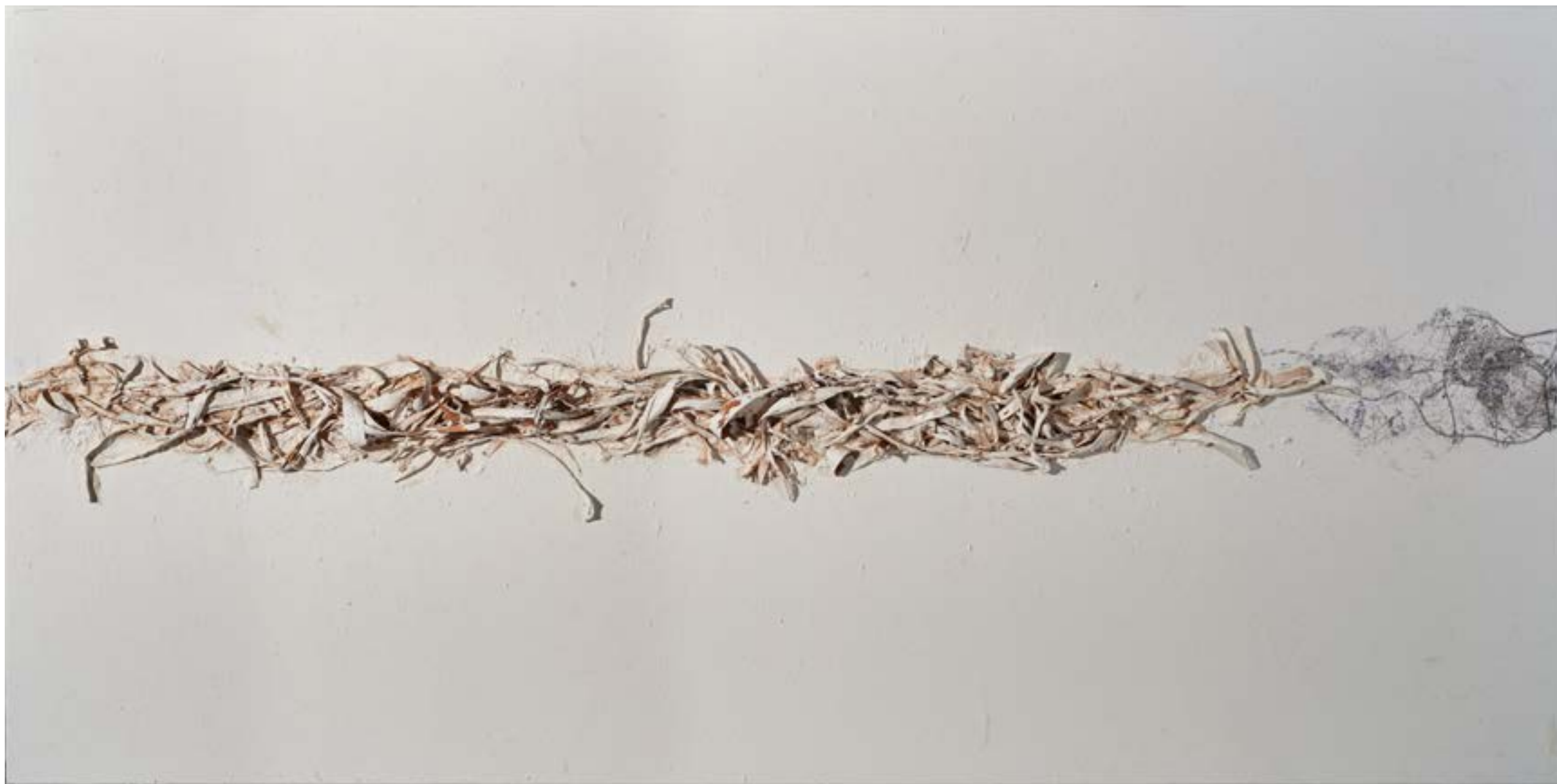
Camí de dia , 2015 Tècnica mixta sobre tela 98 x 195 cm