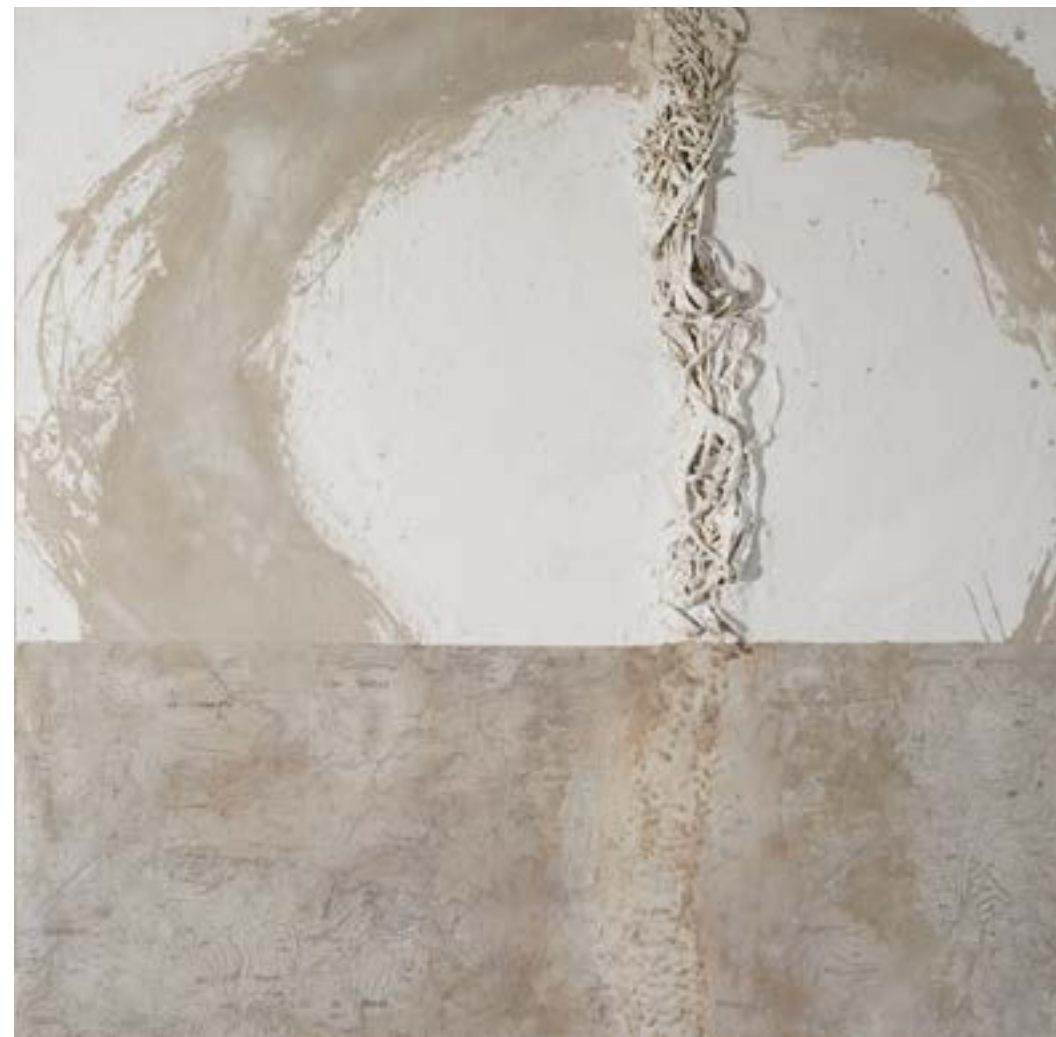
Cartografia de la ment , 2015 Tècnica mixta sobre tela 120 x 120 cm