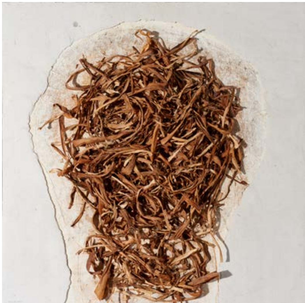
Contorns 1 , 2012/2013 Tècnica mixta sobre tela 100 x 100 cm