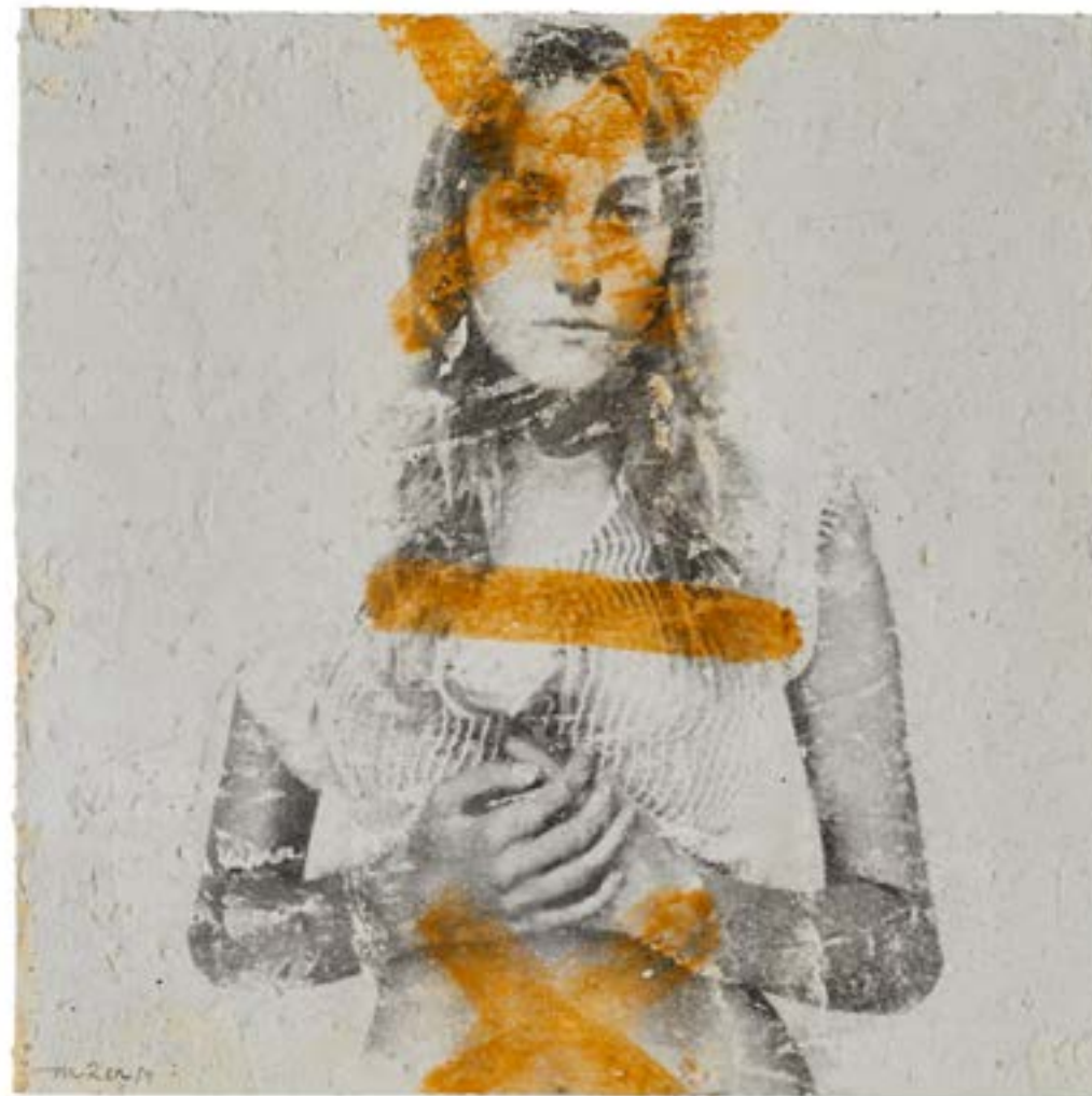
Gretel 1 , 2015 Tècnica mixta sobre paper 20 x 20 cm