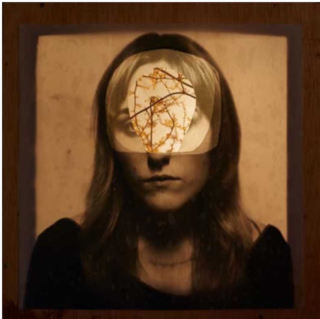
Gretel a on va , 2015 Impressions sobre paper vegetal i esparregueres 50 x 50 x 50 cm