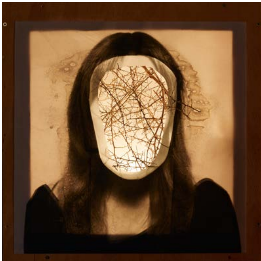
Gretel dins , 2015 Impressions sobre paper vegetal i esparregueres 50 x 50 x 50 cm