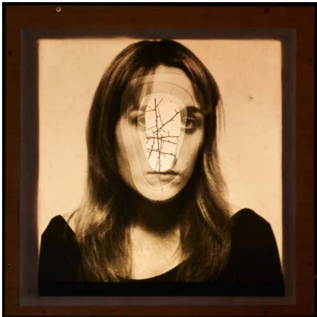
Gretel fora , 2015 Impressions sobre paper vegetal i esparregueres 50 x 50 x 50 cm