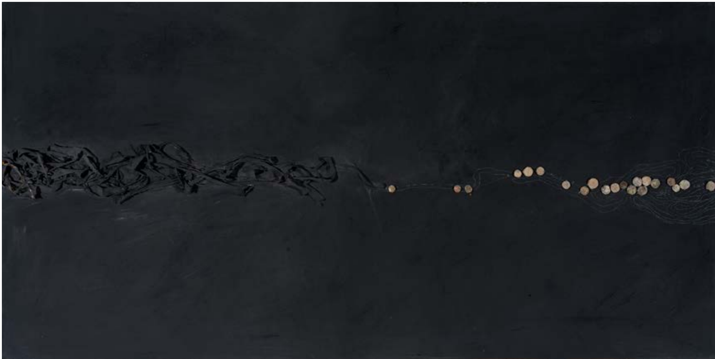
Camí de nit , 2015 Tècnica mixta sobre tela 98 x 195 cm