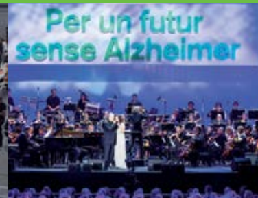
Setembre Concert solidari “ Per un futur sense Alzheimer ” al Palau Sant Jordi de Barcelona.