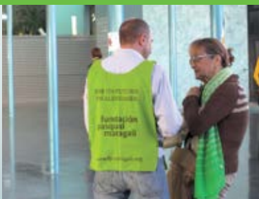
Setembre La Fundació Pasqual Maragall surt al carrer.