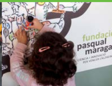
Octubre Portes obertes del Parc de Recerca Biomèdica de Barcelona.