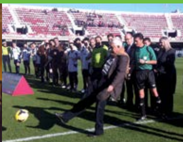
Desembre Xut d'honor de Pasqual Maragall al partit solidari de La Marató de TV3 .