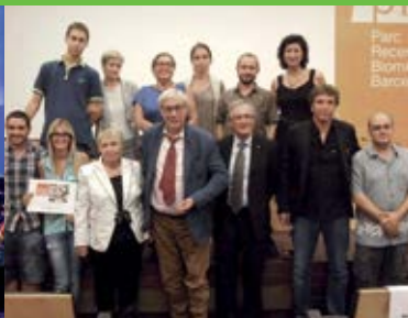
Setembre Lliurament dels guardons de la IV edició del Premi Solé Tura per a cinema sobre malalties del cervell.