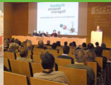
Desembre La Fundació Pasqual Maragall es troba amb els seus socis i donants.