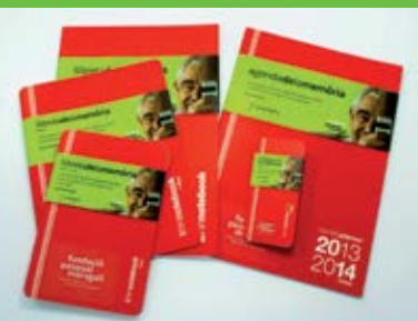
Setembre Agendes i llibretes solidàries d' Octàgon Design .