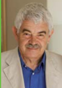
Pasqual Maragall President Honorífic