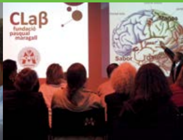
Maig Acte del Claß “L'imperi dels sentits” amb el científic Ignacio Morgado a les instal·lacions de la Fàbrica Moritz.