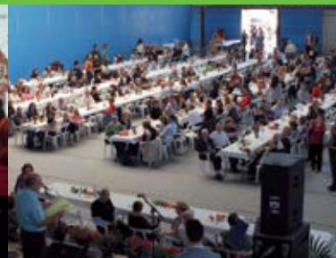
Maig III dinar solidari dels treballadors del Port de Barcelona per recaptar fons per a la lluita contra l'Alzheimer.