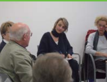
Abril Finalització de l'estudi pilot de grups terapèutics per a cuidadors de persones amb Alzheimer.