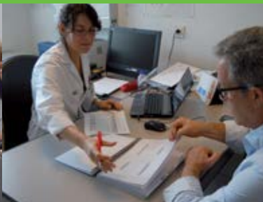
Abril Inici de la primera fase de l'estudi alfa , amb la participació de 2.000 voluntaris.