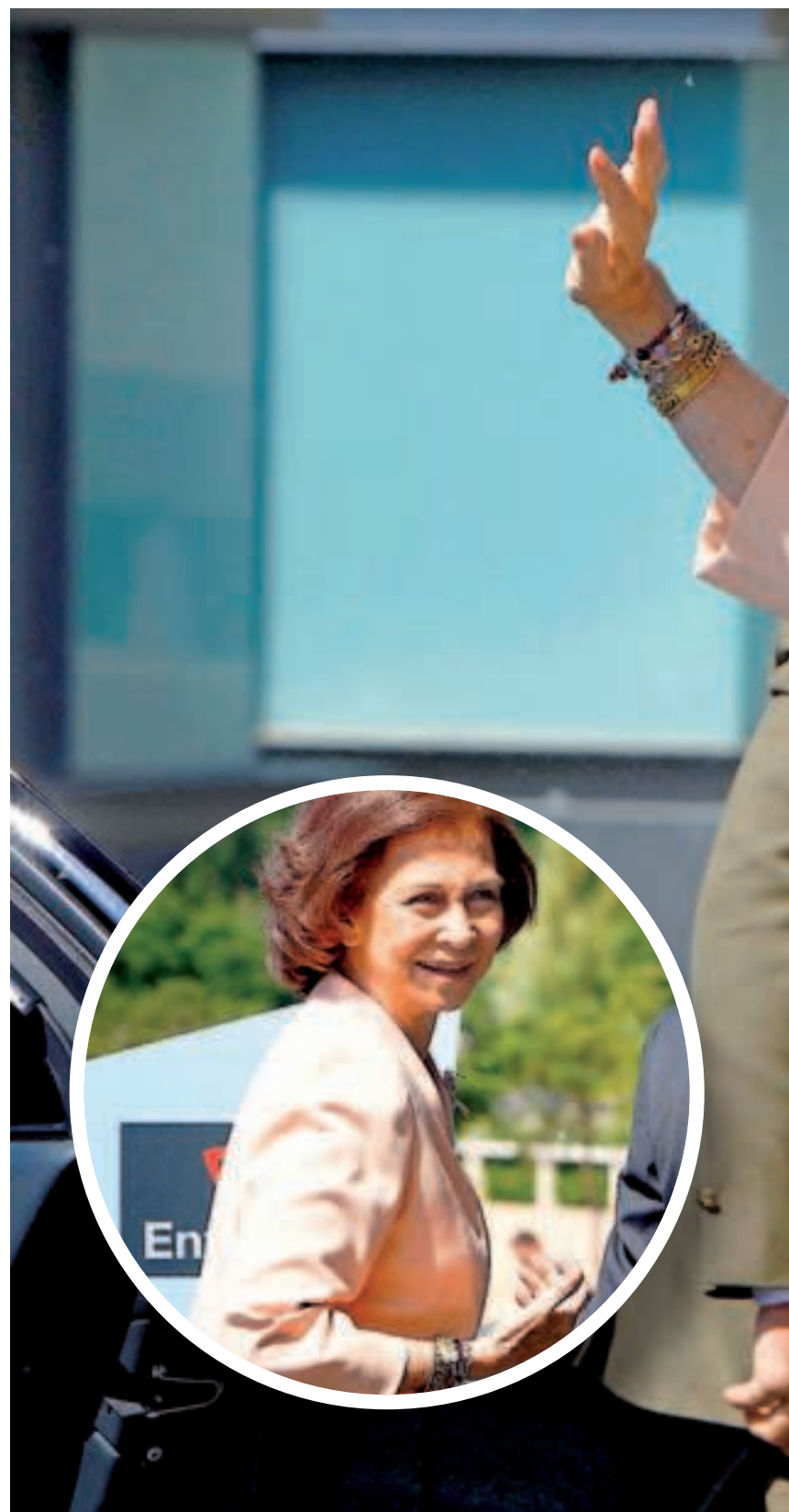
La reina Sofía saluda a su llegada a Riojafórum.