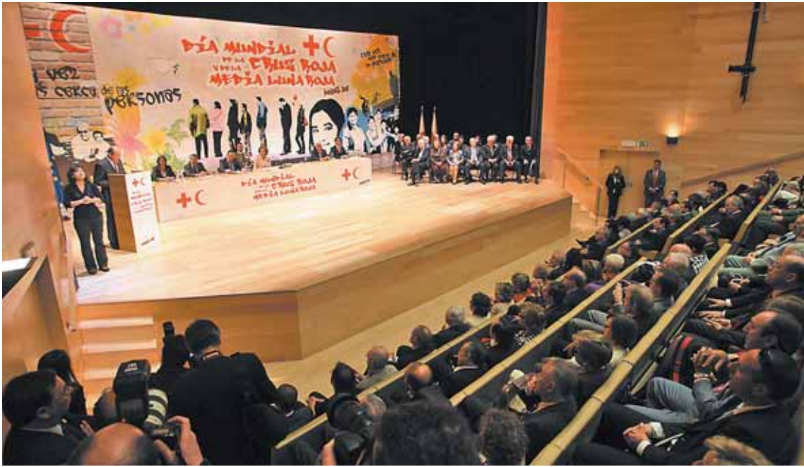
La Cruz Roja Japonesa fue el único colectivo galardonado que no acudió a Riojaforum. El resto de premiados sí recogieron su medalla.