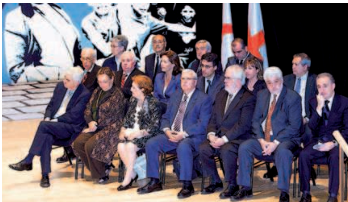
Los premiados, escuchando los discursos.