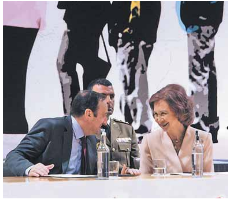
Pedro Sanz y la Reina Sofía compartieron mesa durante el acto de ayer.