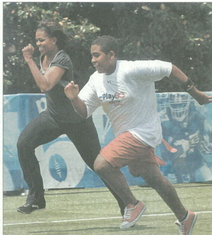
Michelle Obama durante una carrera para fomentar el ejercicio en 2010.

Pero ya lo dice el chef español José Andrés, colaborador de Michelle Obama en temas gastronómicos y habitual en los fogones de la Casa Blanca: "La palabra comida sigue ausente de los temas de importancia en la página web de la Casa Blanca". Aunque Andrés corrige, bromista, enseña: "Excepto cuando se habla de una cena de Estado".