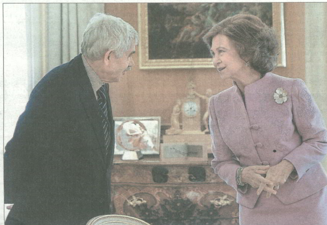
La Reina charla con el expresidente de la Generalitat Pasqual Maragall a su llegada ayer a La Zarzuela.

Las fundaciones que la Reina y Maragall (afectado por esta enfermedad) presiden son las principales promotoras del consorcio que llevará a cabo, entre otras iniciativas, la cumbre internacional sobre el alzhéimer, que afecta a unos 430.000 españoles, los días 22 y 23 de septiembre.