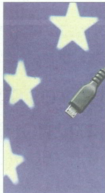
El conector único micro USB