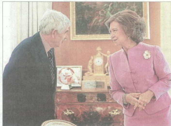
La reina Sofía y Pasqual Maragall, ayer, en la Zarzuela